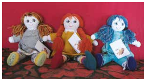
Vse punčke imajo listek z imenom.

Vsako punčko iz blaga poimenuje, saj je tako otrokova čustvena vez z njo že na začetku močnejša. Pridno vodi tudi pravo matično knjigo, v