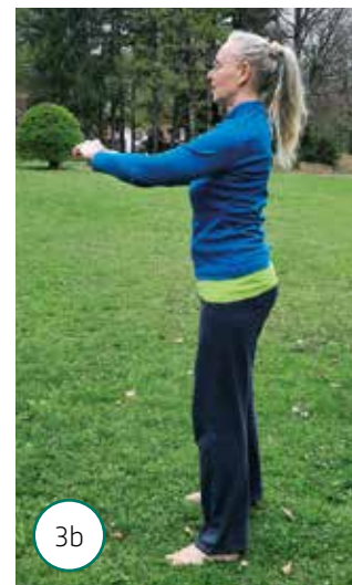
3b ... popolna vzravnavna.

Krčenje kolen (fotografija 5) »odpira« kolena, jih maže in prinaša občutek olajšanja. Krčenje kolena v vzravnanu drži ponovite desetkrat z vsako nogo. Na koncu se doobra pretegnite kot na začetku in dan nadaljujte za kanček lahkotneje kot pred vadbo.