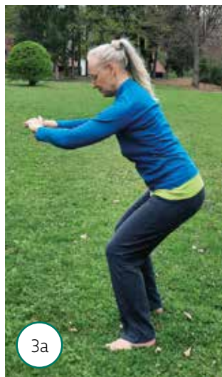
3a Polpočep in ...

Polpočep z rokami v predročju in iztegnjeno hrbtenico (fotografija 3a) krepi mišice nog. V čepu enakomerno dihajte in vztrajajte nekaj sekund, pete pa ves čas potiskajte ob tla. Nato vzravajte telo (fotografija 3b) in popolnoma iztegnite kolena. Vajo ponovite tolikokrat, kolikor zmorete, nato stresite mišice celoga telesa.