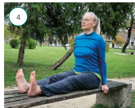
4 Pritisk kolen navzdol