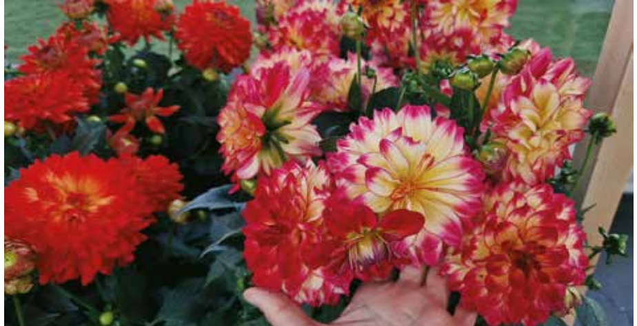
Dalija Labella Maggiore 'Fun Pomegranate'

ni in običajno v različnih barvnih odtenkih. Fuchsia Bella 'Amelia' je ena od sort, ki lepo pokaže to razkošje. Dvojne fuksije najbolje uspevajo, če sproti odstranjujemo njihove odcvetele cvetove, saj tako rastlina ne porablja energije za tvorbo semen, temveč jo usmeri v nastanek novih popkov, kar občutno podaljša obdobje cvetenja.