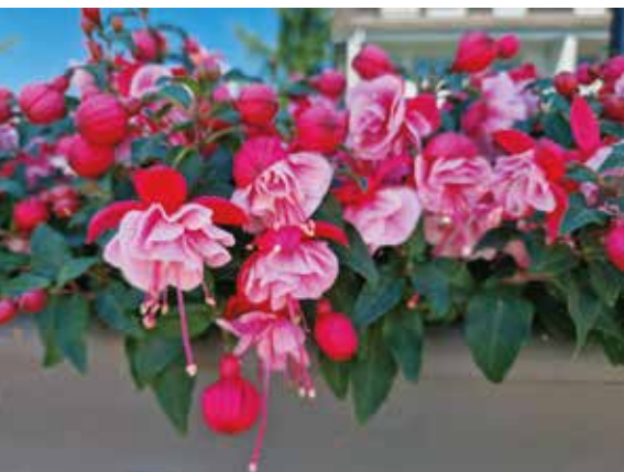
Fuksija Bella 'Amelia'

Fuksija. Čudoviti cvetovi fuksij so pogosto krasili okna domačij, na katerih ni bilo neposrednega opoldanskega sonca. Zato so bile tako priljubljene na starih lesenih balkonih in gankih. Kdor jo je posadil na preveč senčno lego, je bil kmalu razočaran, saj so jo rade napadle uši in tripsi. Polsončne, dobro prevetrene lege obljublajo bogato cvetenje. Zanimivo je, kako se rod med seboj razlikuje po rasti in cvetovih. Pokončne fuksije imajo kratke, kompaktne poganjke, ki se ne prevešajo. Polviseče imajo omejeno rast in se le rahlo upognejo, medtem ko se prevešajoče fuksije z bogatimi cvetovi pod njihovo težo elegantno prevesijo čez rob posode. Cvetovi so videti kot balerine, ki s svojim nežnim gibanjem v vetru poplesujejo na plesišču. Dvojna fuksija ima dva niza cvetnih listov. Venčni listi so kot krilca, čašni pa baročno nabra-