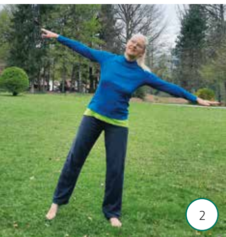
2 Prenos teže z noge na nogo

rahlo dvignite nasprotno nogo od tal. Vaja je nadvse pomembna za razvijanje ravnotežja, kar pomaga preprečevati motnje v ravnotežju in s tem padce. Med izvedbo enakomerno dihajte skozi nos in ponavljajte nihanje do rahle zadihanosti.