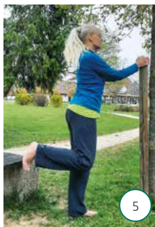
5 Pokrčite koleno in zadržite

Krčenje kolen (fotografija 5) »odpira« kolena, jih maže in prinaša občutek olajšanja. Krčenje kolena v vzravnanu drži ponovite desetkrat z vsako nogo. Na koncu se doobra pretegnite kot na začetku in dan nadaljujte za kanček lahkotneje kot pred vadbo.